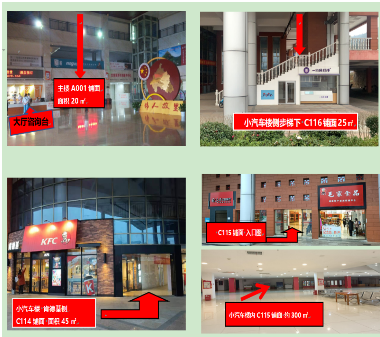
主楼及小汽车楼区域铺面位置图